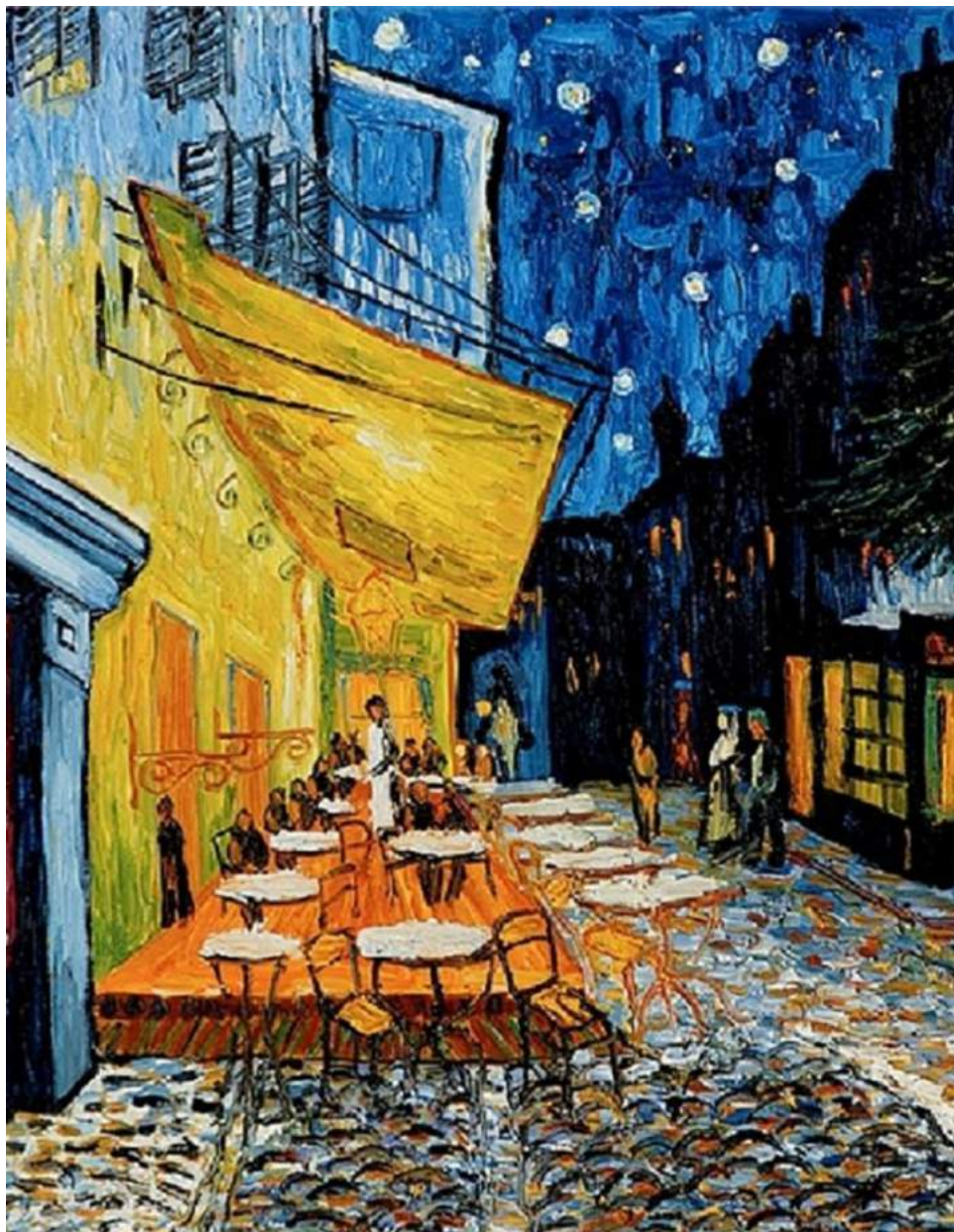
Ван Гог «Ночная терраса кафе»