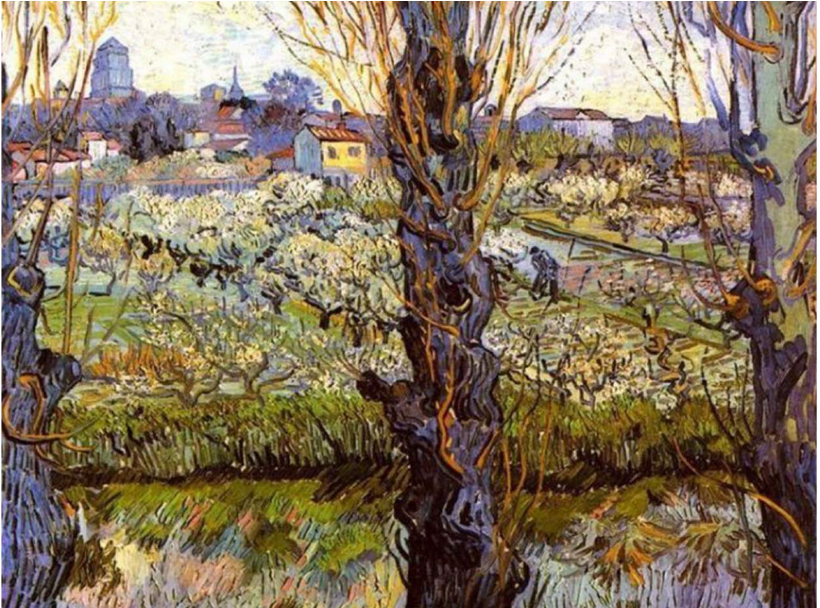
Ван Гог «Цветущий сад с тополями»